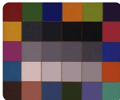
Référence - Xénon source